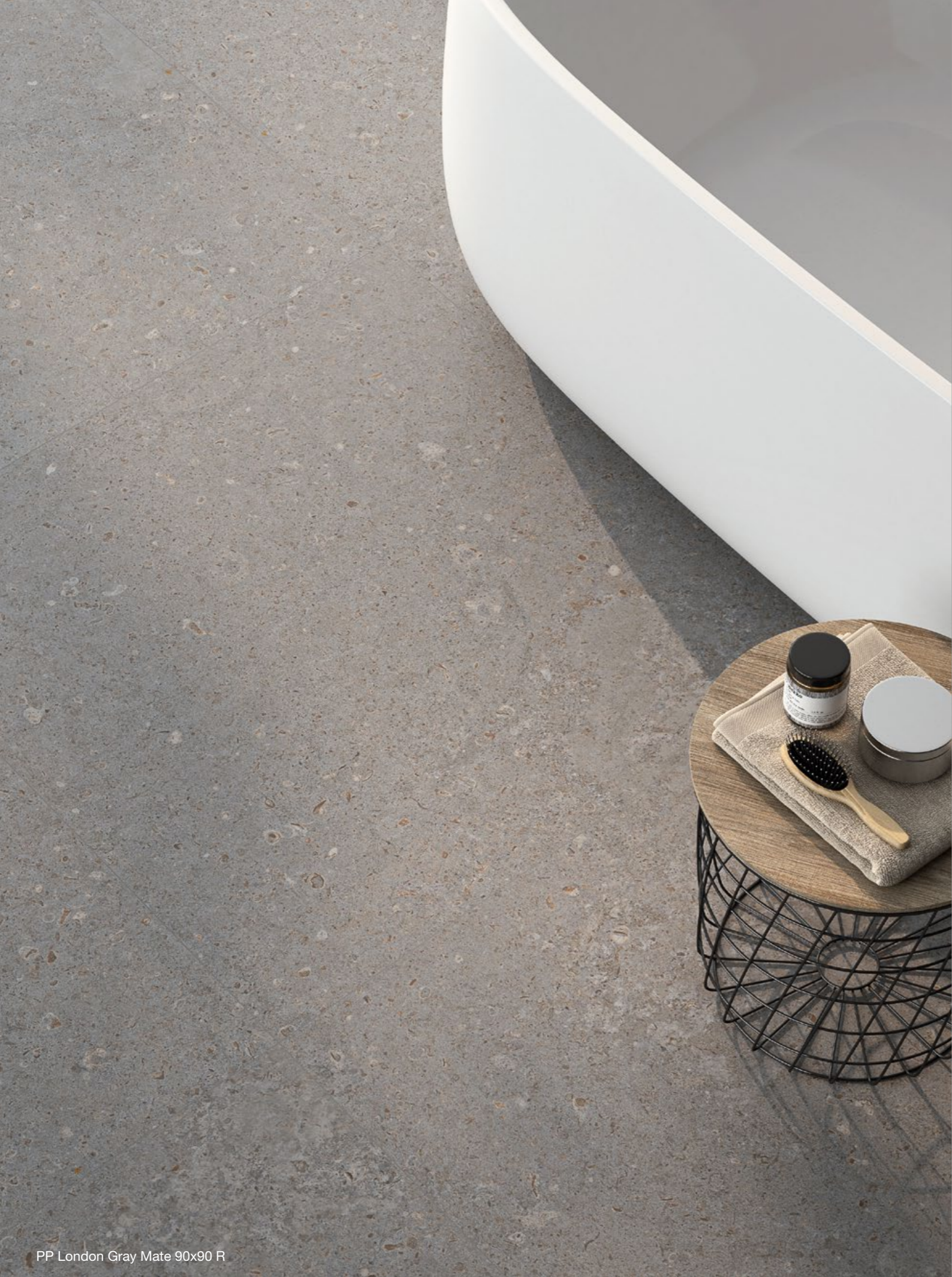
PP London Gray Mate 90x90 R