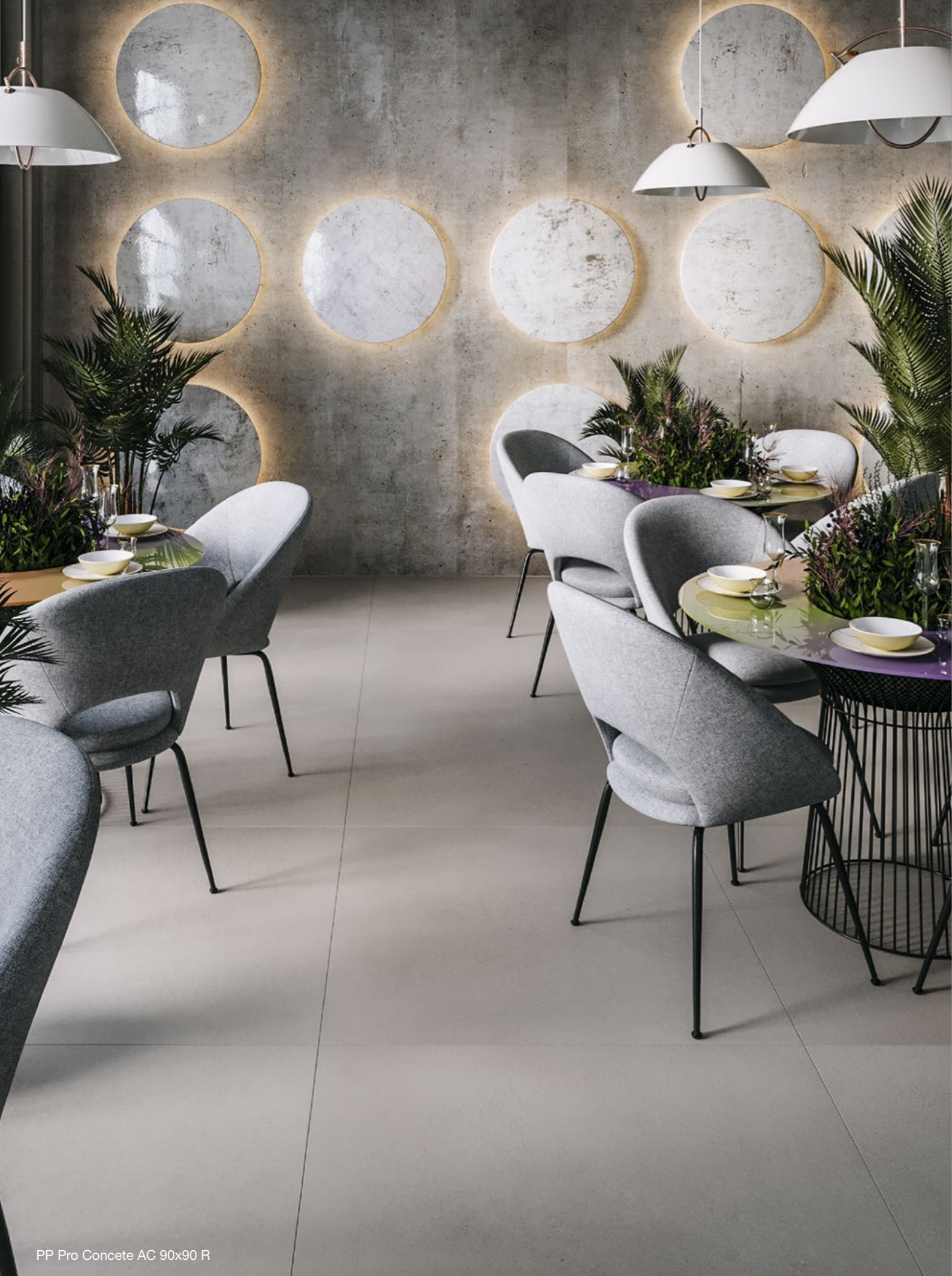
PP Pro Concete AC 90x90 R