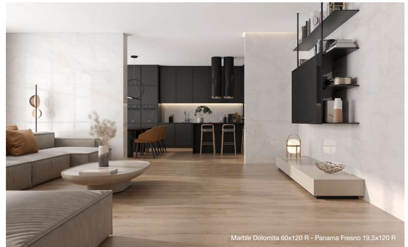
Marble Dolomita 60x120 R - Panama Fresno 19,5x120 R

El acabado del mármol Dolomita es de una calidad excepcional, con una textura suave y uniforme que invita al tacto. La colección se comercializa en pulido y en mate en dos formatos: 60x120 y 90x90, lo que la convierte en una opción perfecta para aquellos que buscan la autenticidad y la veracidad del mármol natural, sin comprometer la calidad y durabilidad de su proyecto. Pierde tu mirada en sus matices, su luminosidad y su equilibrio.