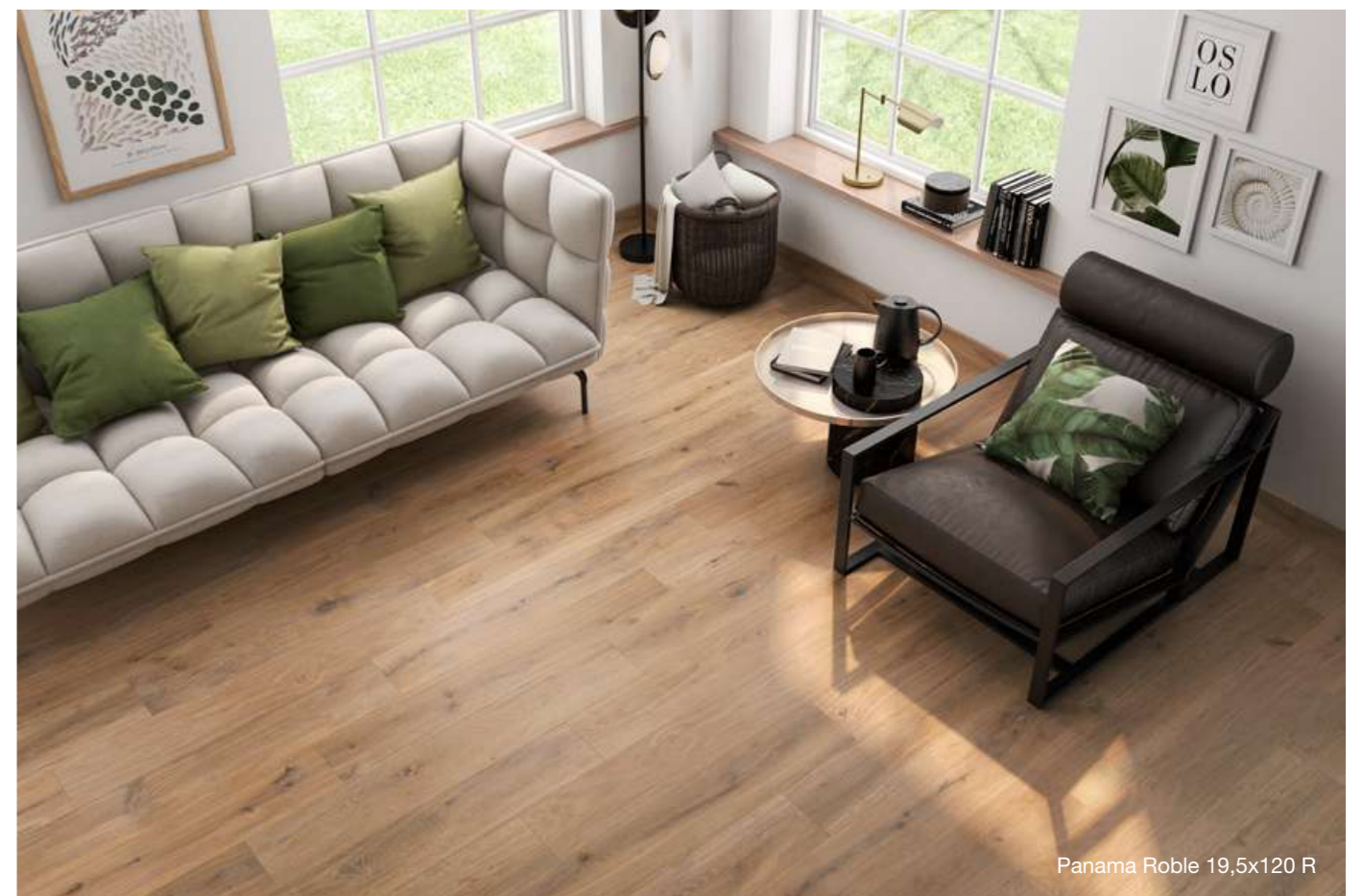
Panama Roble 19,5x120 R