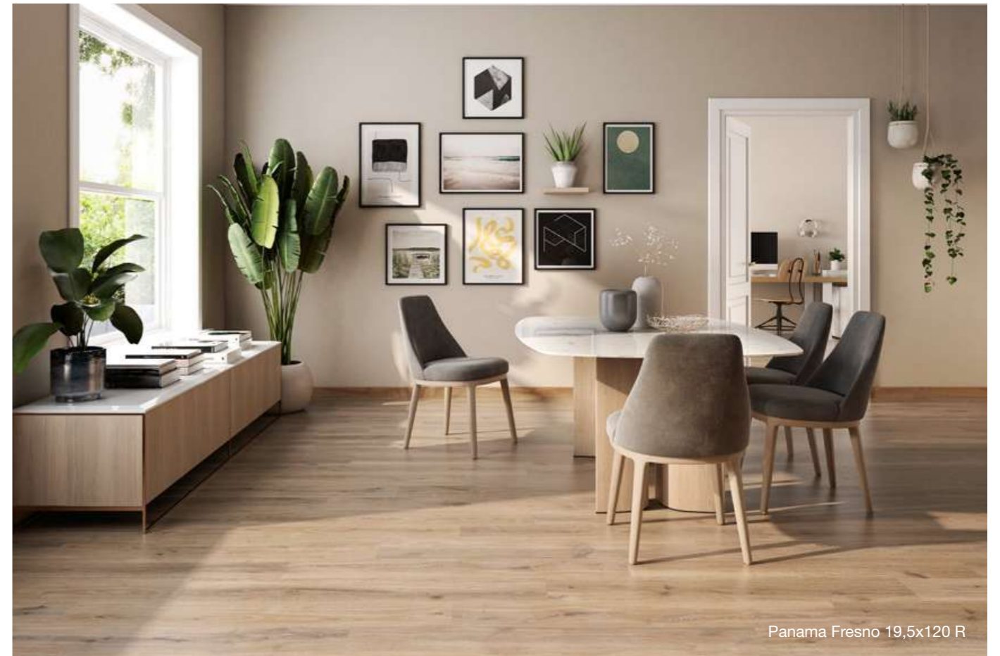
Panama Fresno 19,5x120 R

La colección está disponible en dos acabados: Roble y Fresno, ambos en formato 19,5x120R. Panamá es la unión perfecta de tecnología y diseño, calidad y belleza; la alternativa idónea a las maderas naturales.