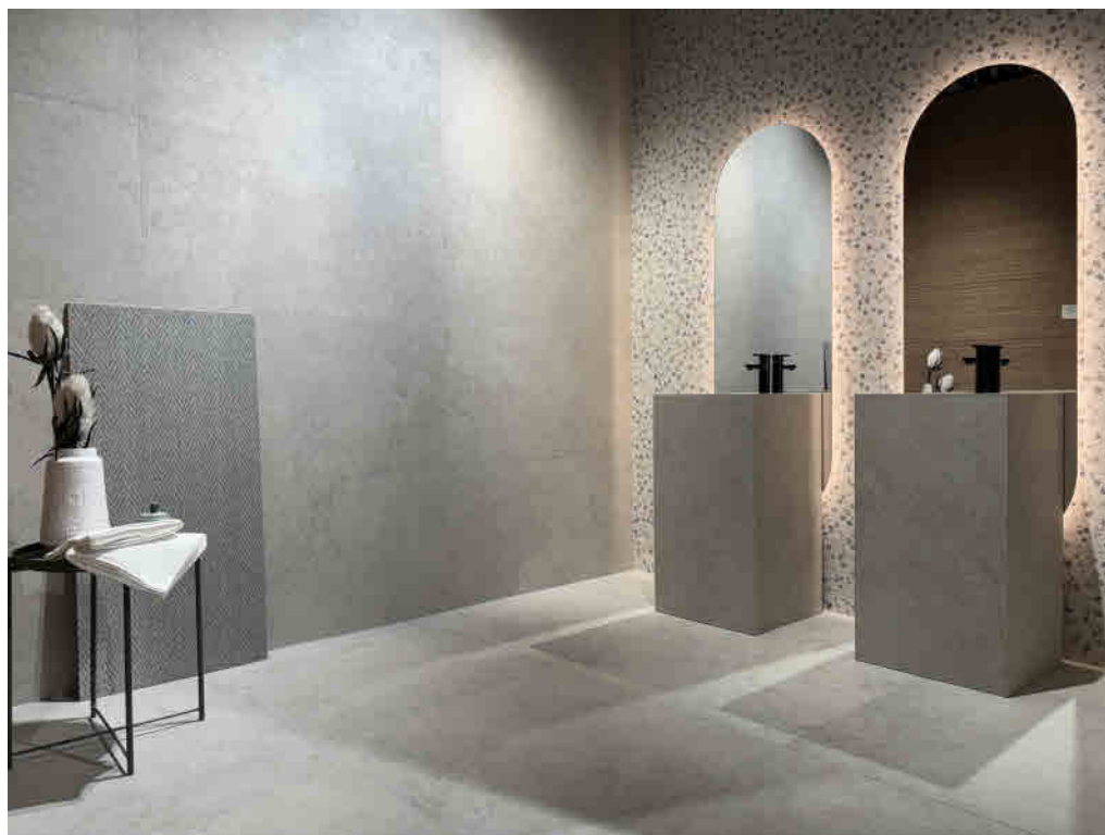
Las instalaciones de la firma en el polígono de Belcaire acogerán una nueva edición de Roca Tiles Open Home, una cita concebida para mostrar las principales novedades de sus propuestas para 2026.